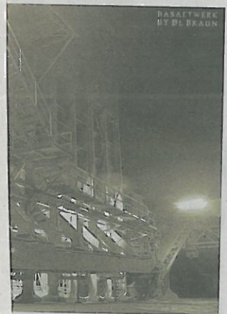
Albersweiler aus der Ausstellung.

...ommen mit VHS SÜW die Gelegenheit etwas der handgemachten Fotokunst zu "konsumieren". Die Ausstellung ist während der Öffnungszeiten Mittwoch bis Samstag ab 18 Uhr und Sonntag ab 16 Uhr für jedermann zugänglich. Die Eröffnung findet mit einem kleinen Rahmenprogramm am Sonntag, 9. August ab 11 Uhr statt.